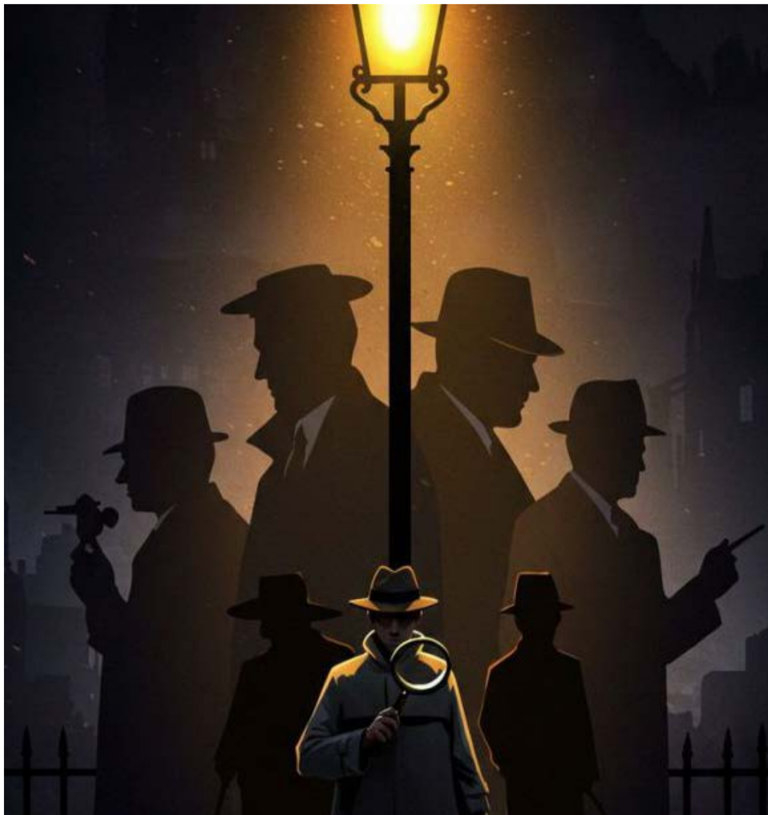
700 capos han sido capturados en Colombia

El jefe de Estado destacó la efectividad de las acciones judiciales recientes, revelando cifras contundentes: «Hemos capturado capos, casi 700... [de los cuales] 500 han sido enviados a Estados Unidos y 200 más a otros lugares del universo».