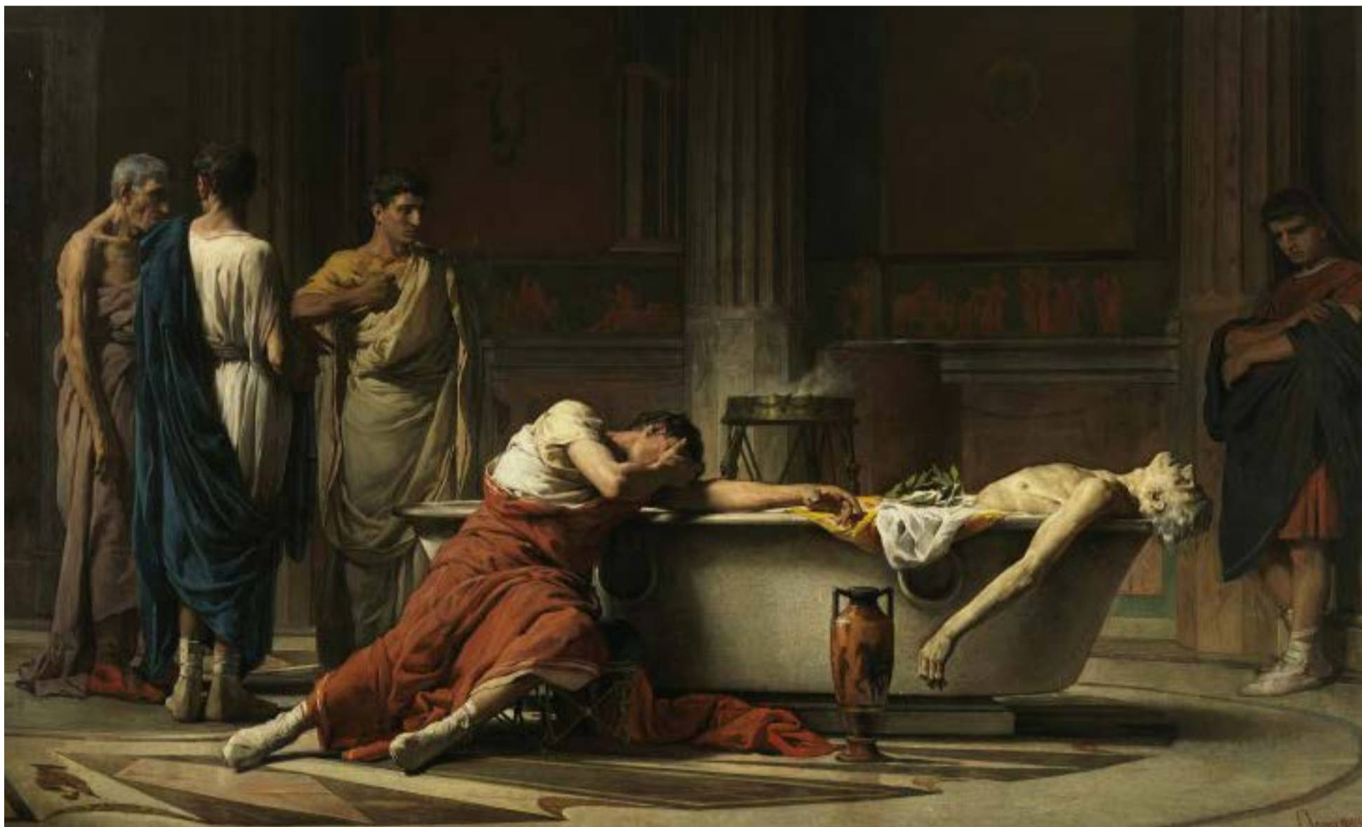
La muerte de Séneca