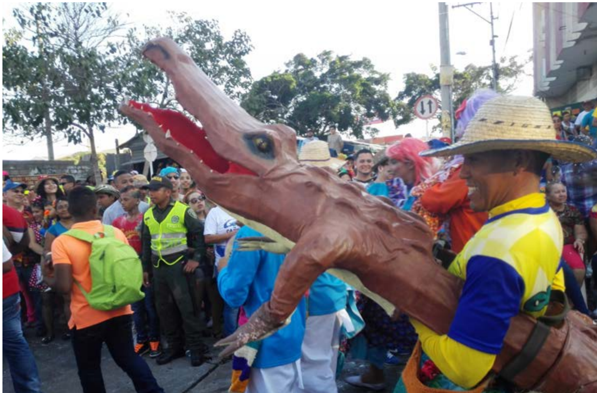
El Carnaval de Barranquilla, es el espacio donde los habitantes de La Arenosa con el baile y el licor olvidan sus problemas.