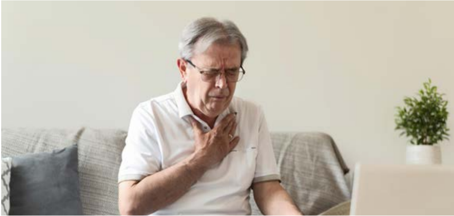
El infarto de miocardio