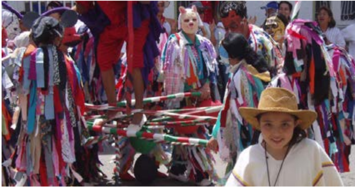
Alegoría a las danzas pijao Baile de matachines