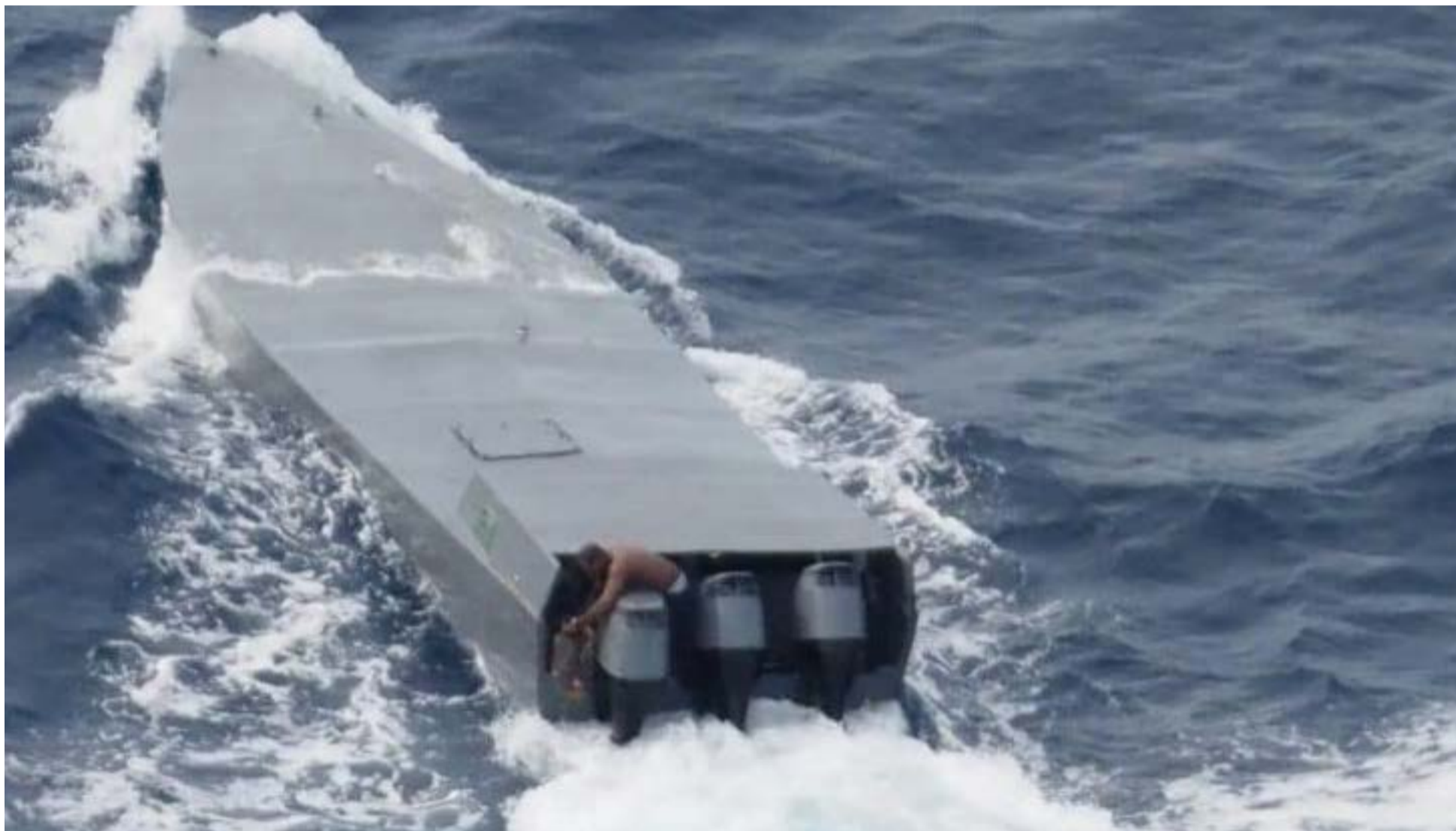
La Intercepción del «Leviatán» de las Diez Toneladas de clorhidrato de Cocaína.