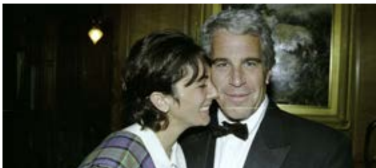
Jeffrey Epstein y su pareja complice Ghislaine Maxwell

Bill Clinton: Su nombre aparece cientos de veces. Fotografías recientes lo muestran en la finca de Epstein. Aunque ha negado irregularidades, los archivos detallan vuelos en el «Lolita Express» y menciones sobre sus gustos personales.